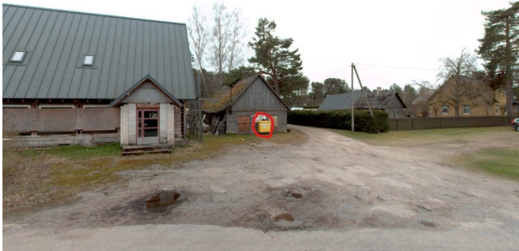
Joonis 2. Avalik jäätmekonteiner, tänavavaade seisuga aprill 2024