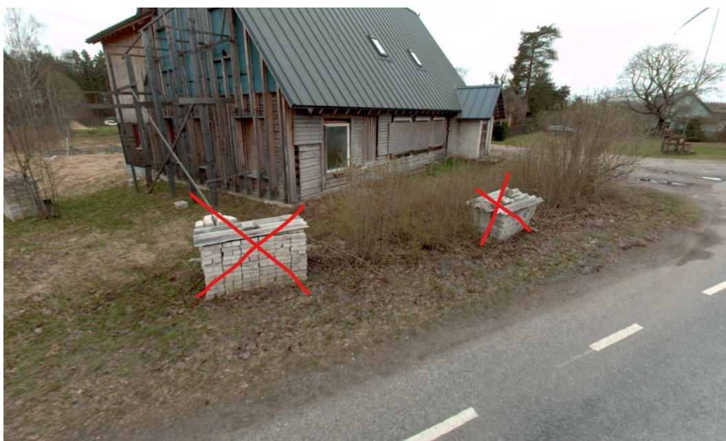
Joonis 4. Riigitee alusele maaüksusele ladustatud ehitusmaterjal, tänavavaade seisuga aprill 2024.

Muuhulgas juhime tähelepanu, et Poe kinnistuga külgneval alal on riigitee alusele maaüksusele (katastritunnus 91501:006:0276) riigitee vaba ruumi alale (normide Lisa 1 Tabel 10) ladustatud ehitusmaterjal (silikaatkivid, vt Joonis 4). Palume nimetatud materjal esimesel võimalusel riigitee aluselt maaüksuselt eemaldada. Palume vabandust, kui antud märkus ei ole hetkel enam asjakohane ning kirjeldatud materjale riigitee alusel maaüksusel enam ei ole.